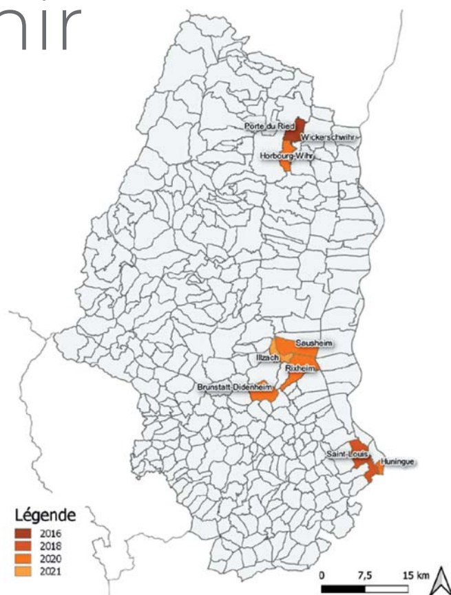
Communes du Haut-Rhin colonisées par Aedes albopictus au 1 er janvier 2022

Mais les moustiques se développent également près des habitations, dans les jardins, les terrasses : récupérateurs d'eau, bassins d'ornement, gouttières bouchées, soucoupes de pots de fleurs, réceptacles divers (seaux, pneus, brouettes, jouets etc.).